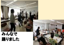
みんなで踊りました