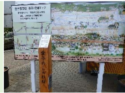
愛子駅前の設置状況

●関山街道の昔の愛子宿の情景がわかるような歴史・史跡案内図や愛子宿内の11ヶ所の「案内表示板」が、町内会や地権者の方のご協力で設置されました。 ●愛子宿めぐりのHPを立ち上げ、QRコードを利用して多言語化のガイド案内を行っています。(http://www.ayasi.info/)