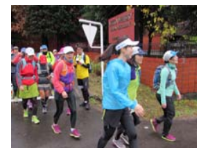
トレイルランニング