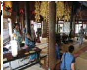
真徳堂(御廂)内の見学