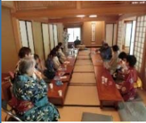
会場の洗心亭翠光