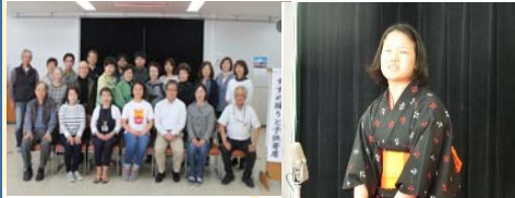
そろって記念撮影