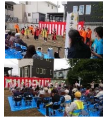
セレモニー 上 よさこい踊り/下 すずめ踊り

* 仙台市協働のまちづくりの実践で ・20の事例に関山街道フォーラム協議会の活動を取り上げていただきました。