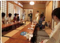
定義節や定義小唄の披露