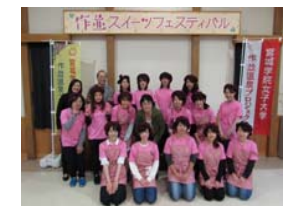
スイーツフェスティバル