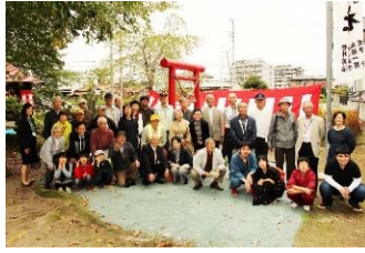
愛子宿めぐり実行委員会や町内会、除幕式開催に向けてお手伝いいただいたみなさんで記念撮影