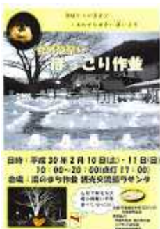
180210ほっこり作並チラシ.jpg 129K