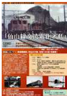
20190126講演会チラシ (ver.1)最終.jpg 298K