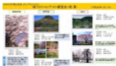
20190629桜フォトコンテスト審査結果.jpg