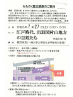
20190727みちのく歴史講座.jpg