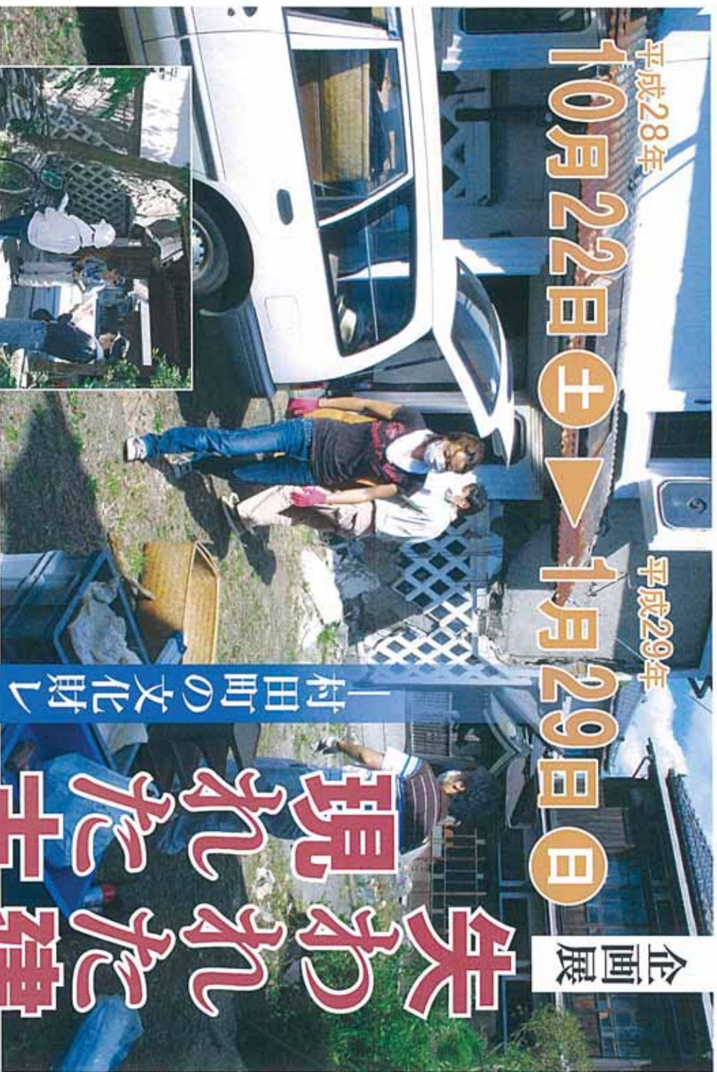
文化財ボクサーによる建物の被害調査