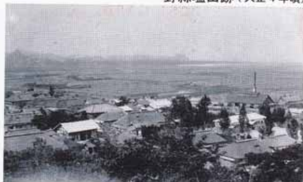
昭和初め頃の野蒜塩田全景 (「野蒜名勝繪はがき」菊地商店発行)