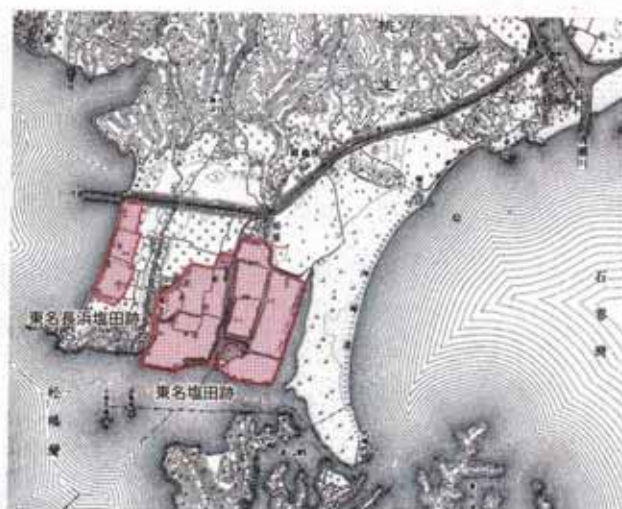
野蒜塩田跡(大正4年頃)