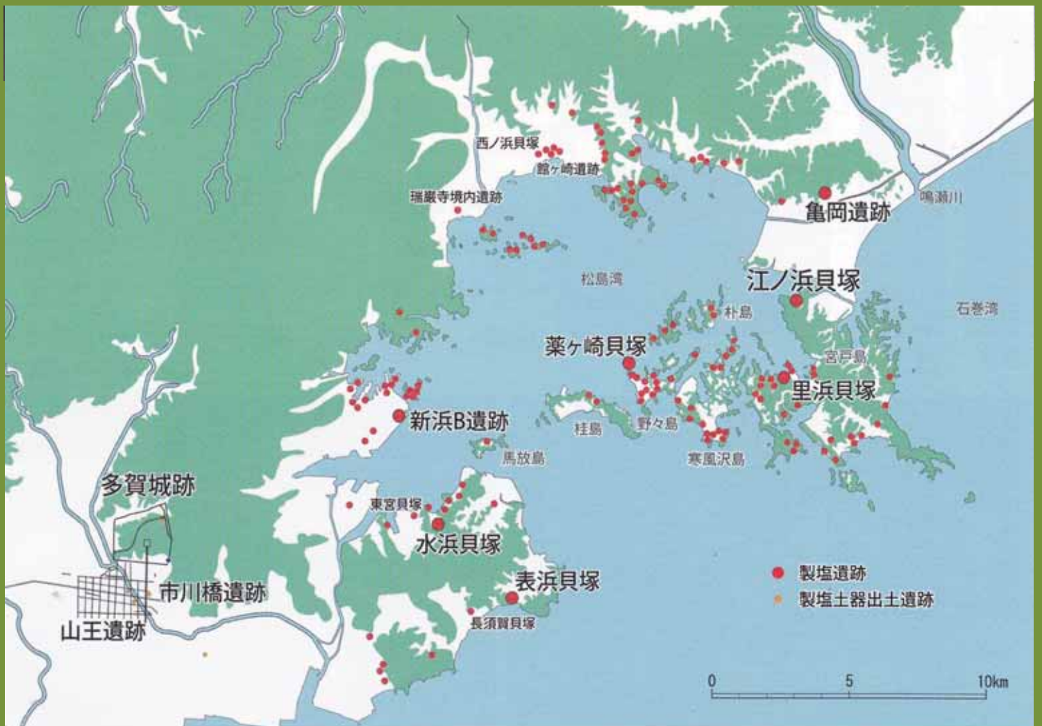
松島湾沿岸の古代製塩遺跡