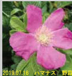
2019.07.16 ハマナス 野蒜海岸