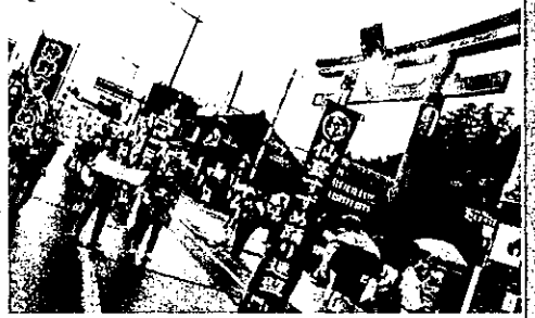
すずめ大流しスタート