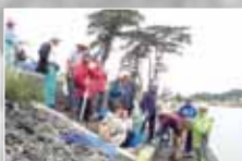
2019.07.16 柴漁 (ならっぱ漁)