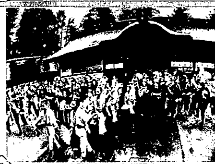
本殿前にて奉納総踊り