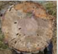
2019.07.30 マツの年輪・新町 不老山の生き物