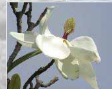
2019.07.01 洲崎湿地 亀岡