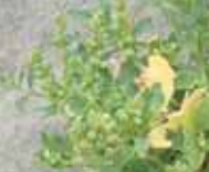
2019.07.29 外来生物 オニハマダイコン駆除 野蒜海岸